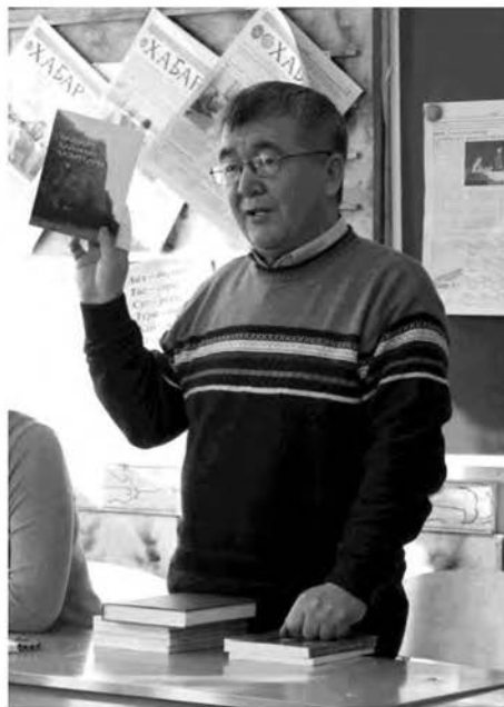
Презентация книги в редакции газеты «Хабар», 2021