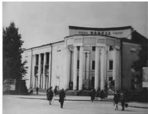
Кинотеатр «Победа», 1970-е гг.

«В соответствии с решением Хакасского Исполкома Облсовета в конце декабря 1944 года приступили к эксплуатации выстроенной части кинотеатра «Победа», имеются зрительный зал на 500 мест и вестибюль.