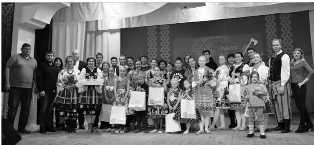
Культурно-национальная общественная организация «Полония» Республики Хакасия, 2022

В 1992 году в Хакасии был принят Закон «О языках народов Республики Хакасия». При поддержке Министерства образования и науки Республики Хакасия был возрожден интерес к изучению польского языка. Возникли два фольклорных ансамбля песни: «Краковянка» и «Кфяты», а также танцевальный народный ансамбль «Сибирский краковяк». Начала свою работу Школа польского языка и культуры. Первым учителем польского языка стал выпускник филологического факультета Абаканского педа-