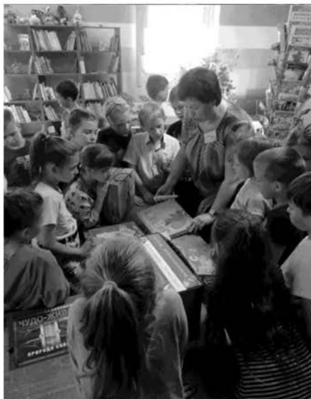
Экскурсия по библиотеке «Сюда приходят дети – узнать про всё на свете», 2023

Программа «О чём не расскажет учебник» стимулируют любознательных читателей к самостоятельной ра-