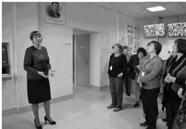
Экскурсия для гостей библиотеки, 2017