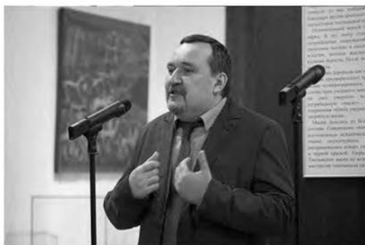
Научно-практическая конференция «Кызласовские чтения», 2016