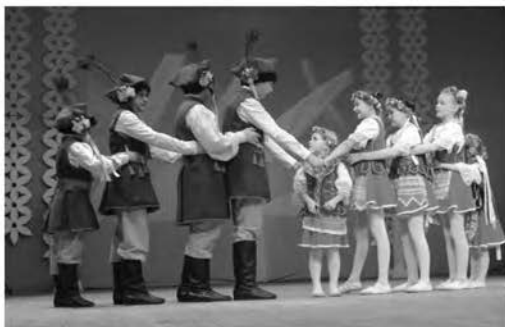
Народный ансамбль танца «Сибирский краковяк», 2022

Хакасии; национальных хакасских праздниках «Чыл пазы» и «Тун пайрам»; Дне славянской письменности и культуры; Дне народного единства; фестивале «Храни свои корни» (организатор – Центральная городская библиотека имени А. С. Пушкина, г. Черногорск) и др.