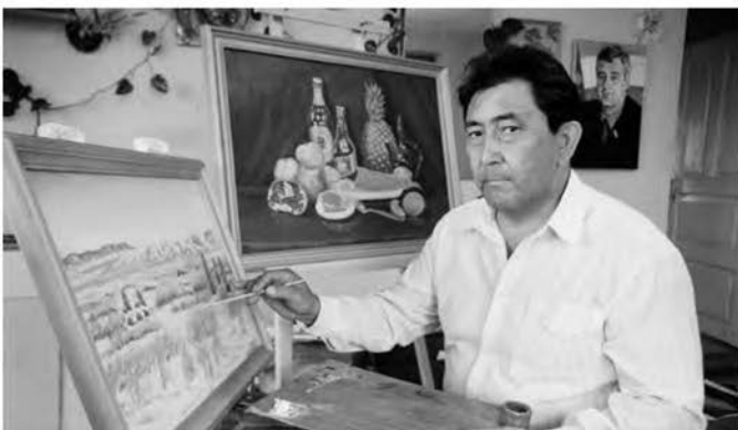
Дома за мольбертом, 2004