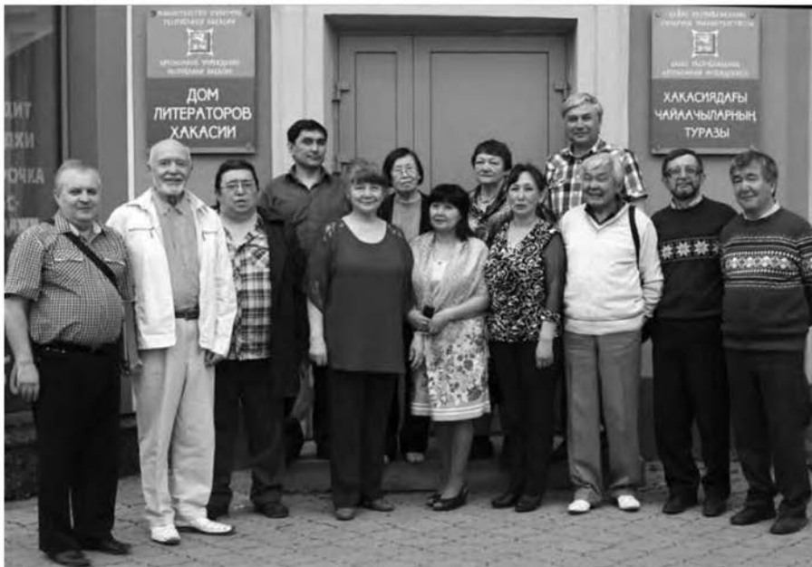
Писатели Хакасии, 2018

В 1949 году на имя поэта и прозаика Николая Доможакова из Москвы пришли документы штатной комиссии Союза писателей СССР за № 7-910, подтверждающие создание Хакасского отделения, там же были предусмотрены одна ставка ответственного секретаря и полставки счетовода. «Этот день, – пишет в воспоминаниях Николай Георгиевич Доможаков, –