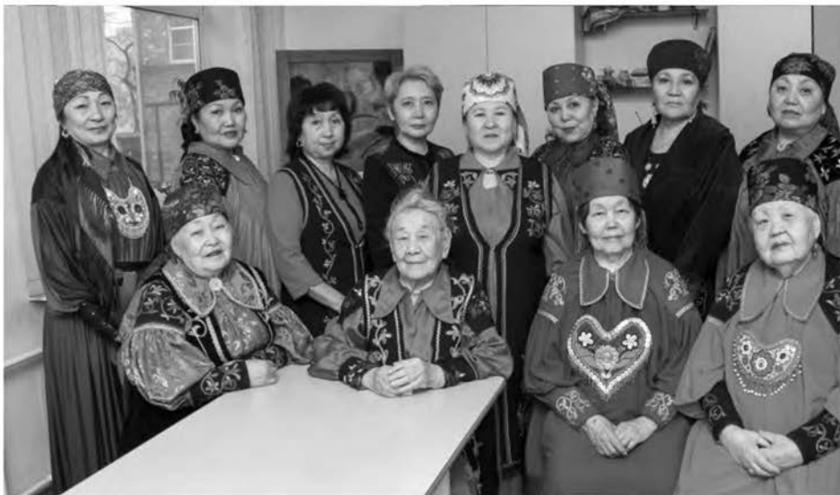
Лига хакасских женщин «Алтынай», 2020