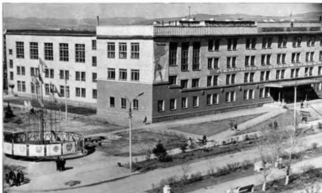
Здание Абаканского педагогического института, 1970-е гг.

Хакасский государственный университет имени Николая Фёдоровича Катанова (далее ХГУ имени Н. Ф. Катанова) – крупнейшее высшее учебное заведение Республики Хакасия. Постановление Правительства Российской Федерации № 724 «О создании Хакасского государственного университета» принято 19 июня 1994 года.