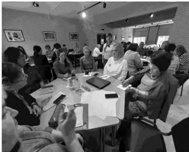
Проектная сессия сотрудников Института. 2023

В 2011 году Институт переименован в Государственное автономное образовательное учреждение Рес-