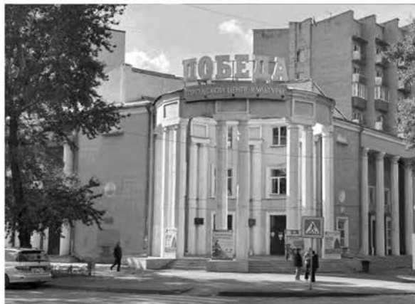
Городской центр культуры «Победа», 2023

Необходимость строительства зимнего кинотеатра в городе Абакане стояла особенно остро. Решение строить новый кинотеатр было принято в 1940 году. Место под его строительство было выбрано не случайно. Так, в целях оформления Первомайской площади было выбрано место на углу улиц Октябрьской (ныне – улица Ленина) и Карла Маркса.