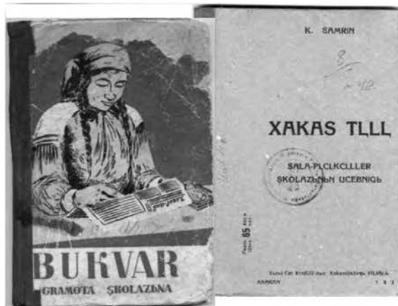
Первые учебники хакасского языка, 1926

Начиная с 1921 года, со времени образования Хакасского округа, на