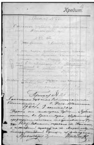
Приказ об утверждении комиссии по созданию хакасской письменности