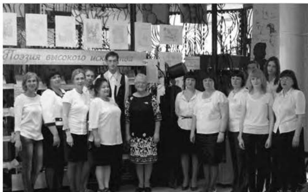
Коллектив Черногорской центральной библиотеки, 2013

средства направлены на материально-техническое обеспечение библиотек города Черногорска: покупку библиотечного оборудования и мебели; приобретение компьютерной техники, оснащение волонтерского центра (с 2000 по 2023 год привлечено более 3 млн. рублей).