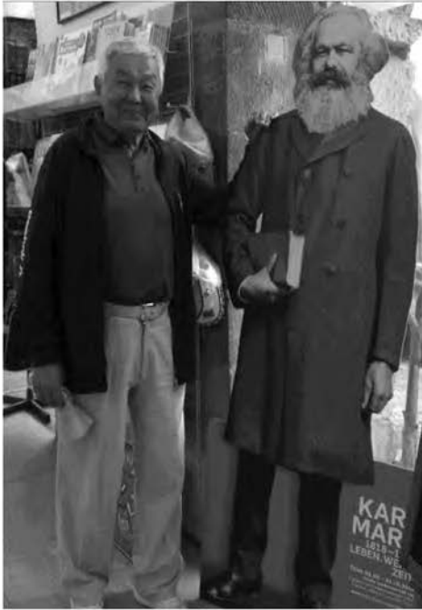
В музее Карла Маркса. Германия, 2018

Так, в 2013 году вышла книга «Куда спешишь, летишь ты время?» на хакасском языке, где впервые были переведены избранные стихи, рубаи и поэма известного хакасского поэта Геннадия Маеркова. А в 2016 году вышел сборник стихов для детей