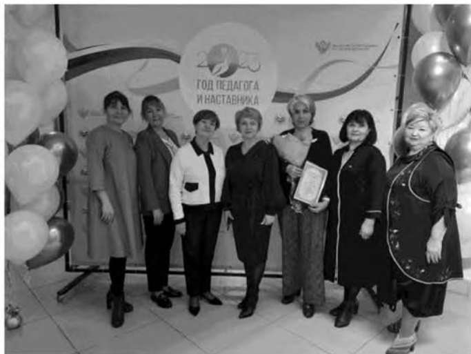
Открытие года Педагога и наставника в Республике Хакасия, 2023

Государственное автономное образовательное учреждение Республики Хакасия дополнительного профессионального образования «Хакасский институт развития образования и повышения квалификации» – одно из старейших учреждений дополнительного профессионального образо-