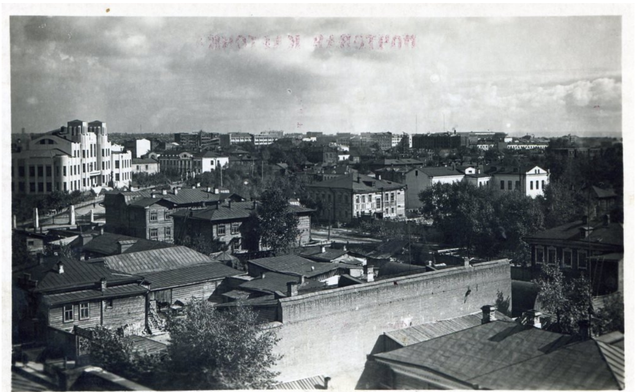
Почтовая карточка. Новосибирская фотомастерская Запсибтреста «Роскино».

По материалам фондов ГАНО Д-97 и Д-150 восстановлены имена хозяев и других участков этого и других кварталов, они представлены на рисунке.