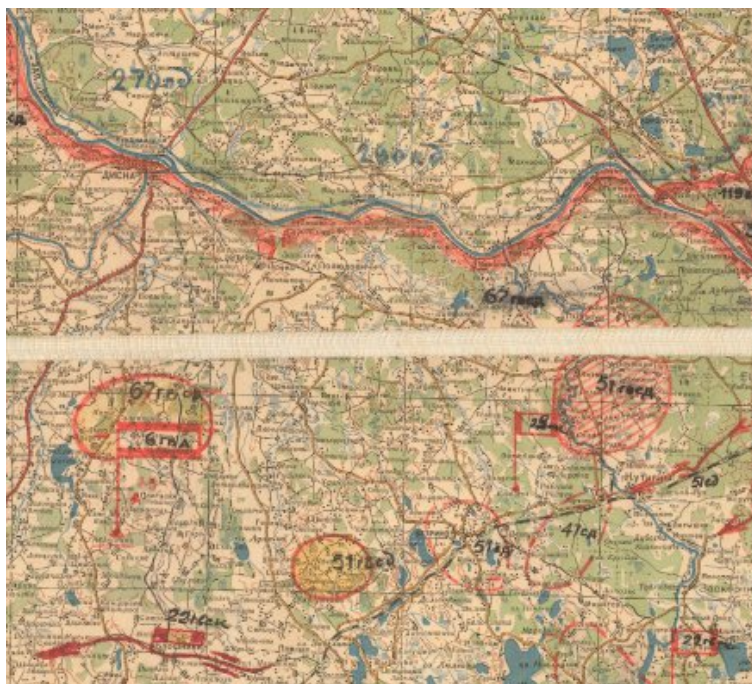
Рисунок 2. Отчетная карта 1 ПрибФ с 1.7 по 6.7.1944 г. Фрагмент

Крупные боевые действия начались 12 июля. В течение ночи противник контратаковал 6 раз, используя САУ и танки, все контратаки были отбиты. Видя эти успехи, командир 199-й гв. сп приказал ударить во фланг противнику через Струпья на м. Смолвы. Благодаря этому, латышский полк СС понес тяжёлые потери и отступил глубоко в тыл. В течение дня было уничтожено 350 солдат противника и захвачены важные разведданные.