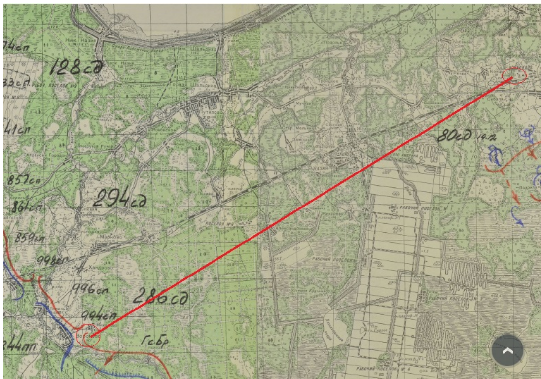
Рисунок 2: Направление движения Войбокало-Вороново.