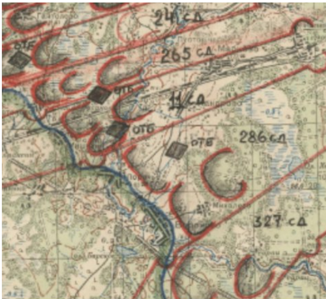
Рисунок 4: Направление наступления 286 СД в сентябре 1942.