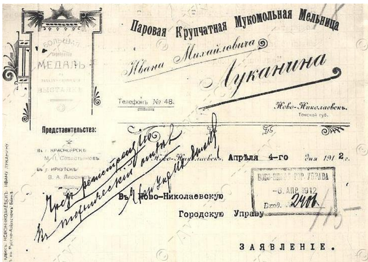
Бланк паровой крупчатой мельницы бр. Луканиных. 1912 г. 16