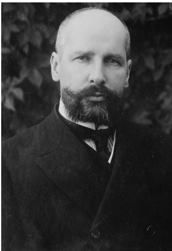
Пётр Аркадьевич Столыпин