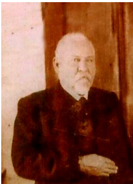
Яков Абрамович Реймер. Минувшие дни. Славгород. № 5. 2010

«Это не просьба, а целая просьбища!» – воскликнул, согласно газетному очерку, Столыпин, но тем не менее обещал и железную дорогу, и больницу, и почту. Постепенно эти обещания были выполнены, правда, железная дорога, построенная уже после смерти Столыпина, в период Первой мировой войны (1914–1916 гг.), не дошла до колоний, а прошла только в Славгород. Но и это было большим облегчением, ведь до этого, как уже было сказано, приходилось колонистам везти свое зерно, другие продукты в Камень-на-Оби за 200 верст, что стоило очень дорого.